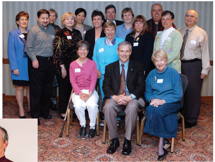
Membres du Groupe de travail sur l'échange des connaissances (GTEC).