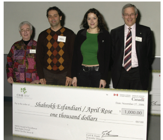
Remise de prix pour une présentation par affiches : IALA en action, Calgary, 2006.