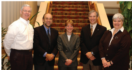
Annnonce des équipes en voie de formation sur l'arthrose.