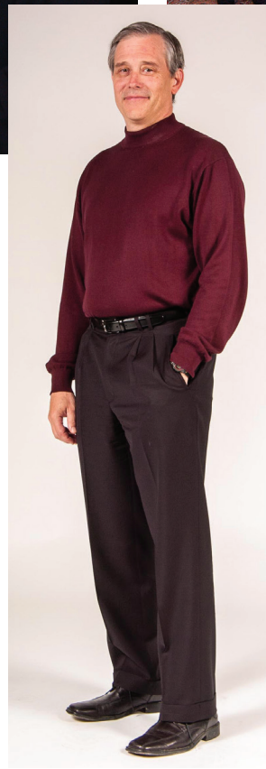
Profil des IRSC.