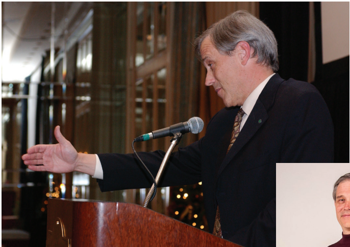
Annnonce des équipes en voie de formation sur l'arthrose.