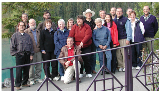
Première séance de réflexion du CCI, 2001.